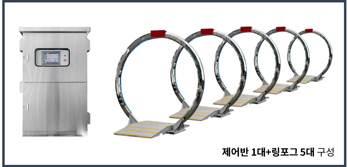
제어반 1대+링포그 5대 구성