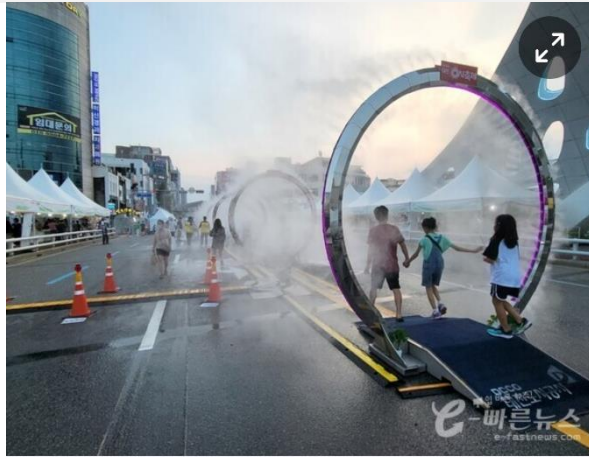
14일의 대전 0시축제, 과거에서 현재로, 목적교의 0형상의 쿨링포그가 방문객들에게 포토존과 동시에 시원함과 즐거움을 주고 있다.