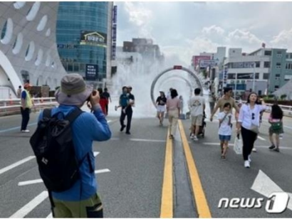
목적교에 설치된 쿨링포그.